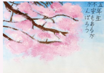
5年 澤野 碧都 (島田)

評 5年生になった今の気持ちを5・7・5で表現しました。背景の桜は、枝も花びらも細かい部分まで丁寧に描き上げました。